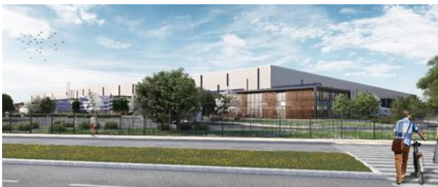
Perspectives