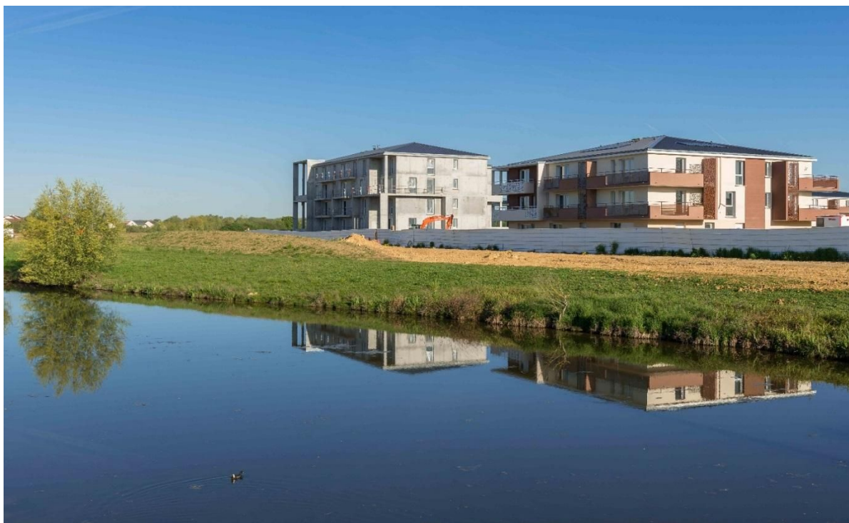
« Les terrasses de Chanteloup » - Nexity - ZAC de Chanteloup- Moissy-Cramayel