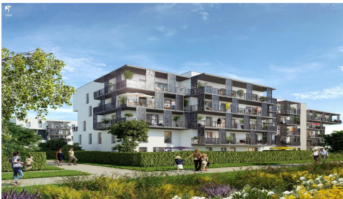
« OuVERTure » Bouygues Immobilier- Eco-quartier Eau Vive- Lieusaint

Pour la 2 ème phase de développement de l'éco-quartier (800 logements), les élus et l'EPA visent la poursuite de cette exemplarité.