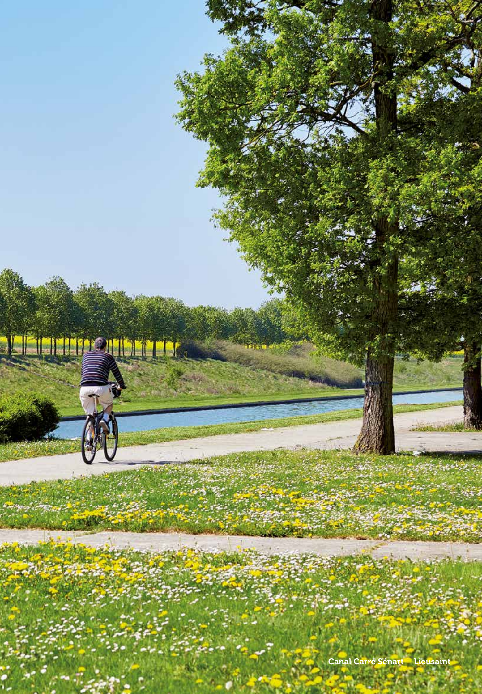
Canal Carré Sénart – Lieusaint