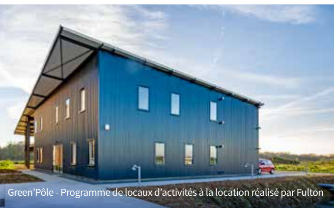
Green'Pôle - Programme de locaux d'activités à la location réalisé par Fulton