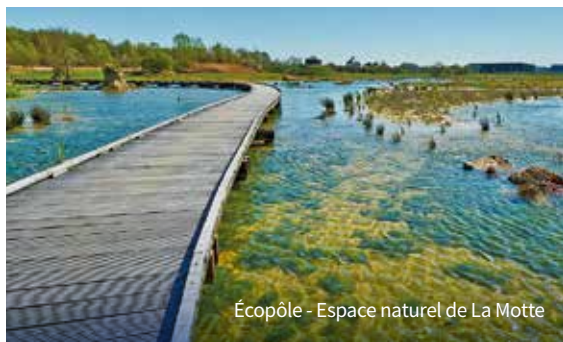
Écopôle - Espace naturel de La Motte

L'espace naturel de La Motte est un espace remarquable par sa biodiversité. Il offre un lieu agréable et ouvert à tous (bassins, circuits pédagogiques, observatoires, pontons).