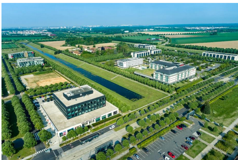
Le Carré Sénart

A l'occasion du SIEC (Salon du retail et de l'immobilier commercial) 2022, la startup Mytraffic, spécialiste de la collecte et de l'analyse des flux de données de fréquentation piétonne et véhiculaire, a présenté son premier palmarès de l'attractivité des zones commerciales de périphérie, en partenariat avec la Fédération des Acteurs du Commerce dans les Territoires (ex-CNCC). Avec la plus forte progression de fréquentation sur 1 an parmi les 143 zones commerciales étudiées, la ZAC du Carré Sénart, située à Lieusaint, au cœur de l'agglomération Grand Paris Sud, arrive en tête de ce classement national.