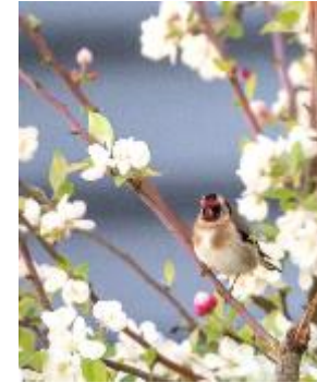
PAYSAGE ET BIODIVERSITÉ