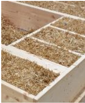
ÉCONOMIE CIRCULAIRE ET CONSTRUCTION BAS CARBONE

RÉPONDANT PARFAITEMENT AUX ENJEUX ENVIRONNEMENTAUX DE SOBRIÉTÉ FONCIÈRE, DE TRANSITION ÉCOLOGIQUE ET ÉNERGÉTIQUE