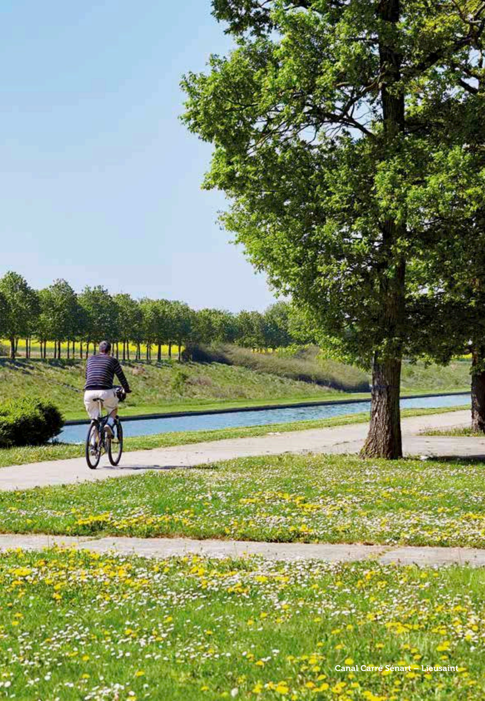
Canal Carré Sénart – Lieusaint